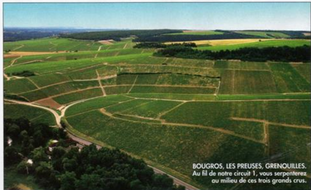
BOUGROS, LES PREUSES, GRENOUILLES. Au fil de notre circuit 1, vous serpenterez au milieu de ces trois grands crus.